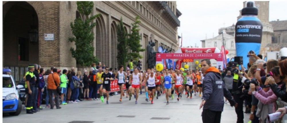
Aplazado el Maratón de Zaragoza

Este domingo era la cita de los maratonianos en la capital de Aragón pero esta vez los 42'195 km tendrán que esperar. EL Ayuntamiento de Zaragoza ha anunciado esta tarde que la XII edición de su maratón que estaba previsto que se celebrará este próximo domingo se tenía que cancelar. La ciudad debe prestar todos sus efectivos y toda su atención a la gran crecida que sufra el Ebro este domingo. Hasta un total de 1800 corredores se habían inscrito para el reto del Maratón de Zaragoza. Como es lógico se suspende también la prueba de 10 kilómetros que había de celebrarse a la vez que los 42 km. El comunicado oficial habla de aplazamiento de la prueba pero no habla da ninguna nueva fecha.