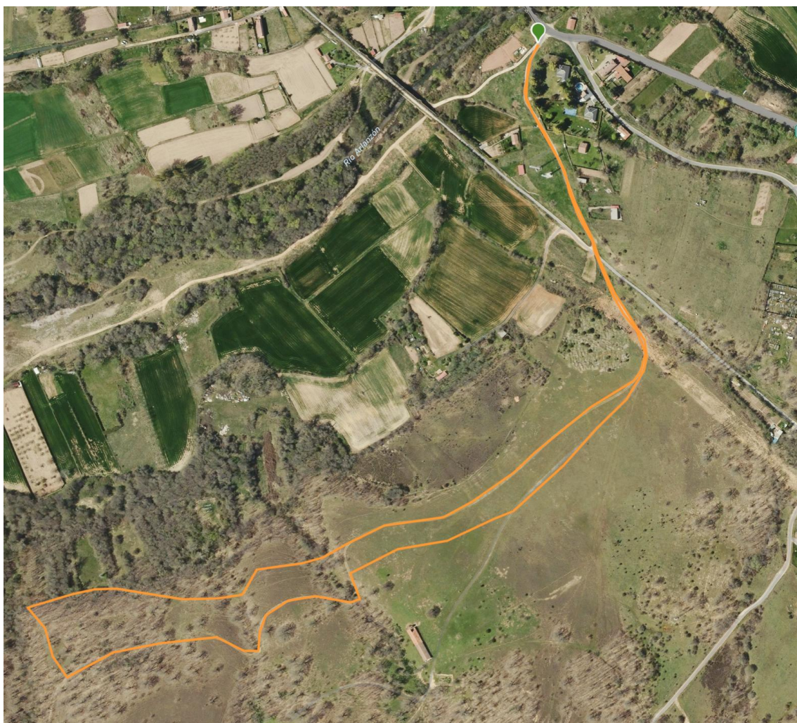
Canicross Popular 2,5 km + 16m