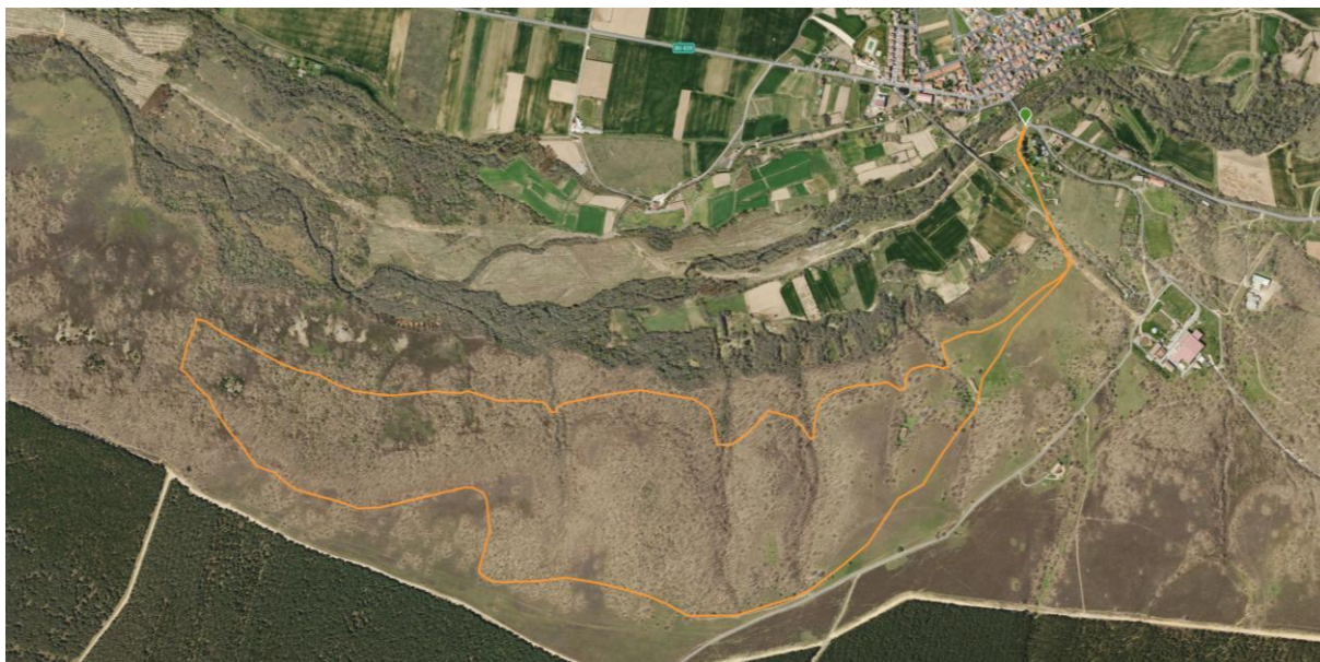
Bikejoring 7,2 km +88m